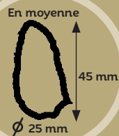
Tapis de pelotes de Chouette effraie