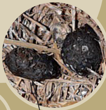
Pelotes de Buse