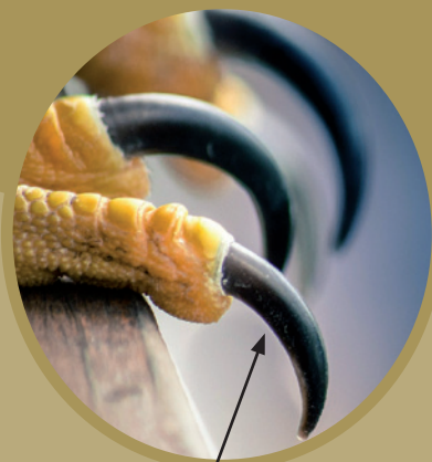
Serres = griffes acérées recourbées